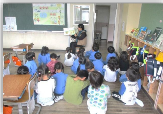
1年生の読み聞かせ