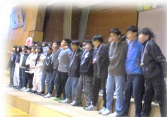
6年生から歌のプレゼント