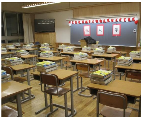
入学式前の教室 初めての新生徒を待っていました。

<新校舎の紹介(一部) 入学式前日の様子 先生方が一生懸命に準備をしていました。>