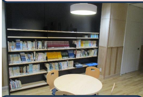
メディアセンター横学習スペース おしゃれな照明で学習できます。