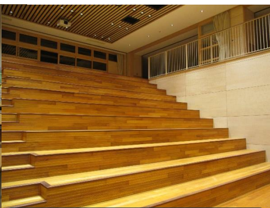
プレゼンテーションルーム 縄文・市民科の発表にも使います。