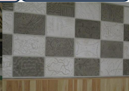
トイレのタイル この春の卒業生が描きました。