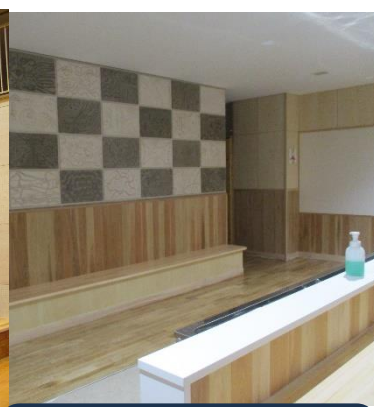
トイレ 綺麗なトイレがたくさん。