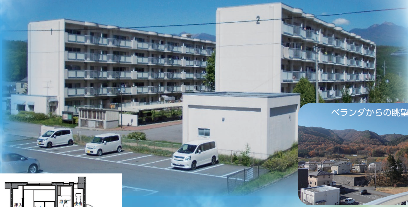
ベランダからの眺望