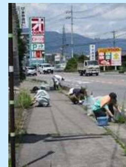
沿線の環境整備活動

ビーナスライン沿線の草刈りやゴミ拾い等の環境整備 (歩道のゴミ拾い・草刈り、支障木の伐採など)