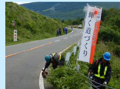
沿線の環境整備活動