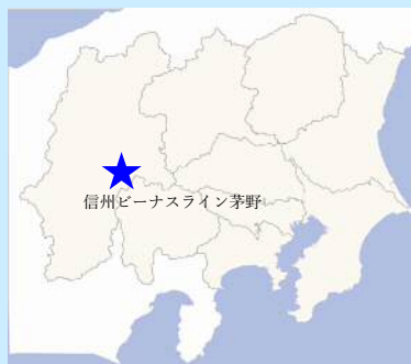
信州ビーナスライン茅野