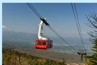
北八ヶ岳ロープウェイ