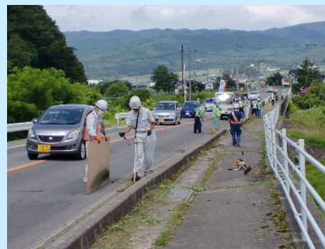
沿線の環境整備活動