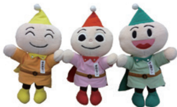
「元気もりもり食育プラン」推進キャラクター 3人の栄養マン

家庭や友達等と作る楽しさ、食べる楽しさを感じるとともに、食への感謝の気持ちをもち、コミュニケーションアップを図ります。