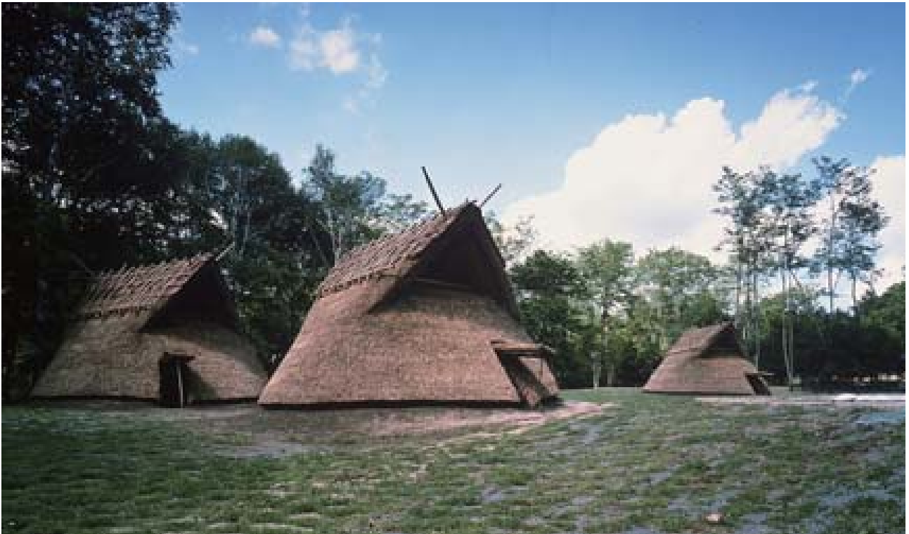
与助尾根遺跡の整備 (平成 12 年)