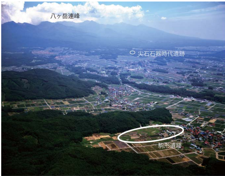
駒形遺跡と遠方に望む八ヶ岳連峰（北西から）