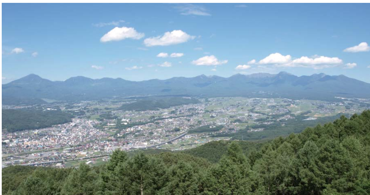
杖突峠から茅野市を望む