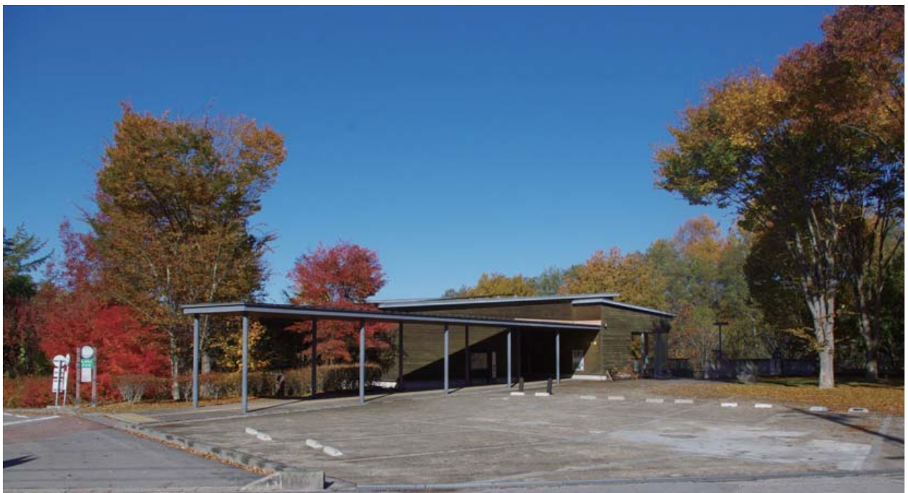
尖石縄文考古館 (秋)