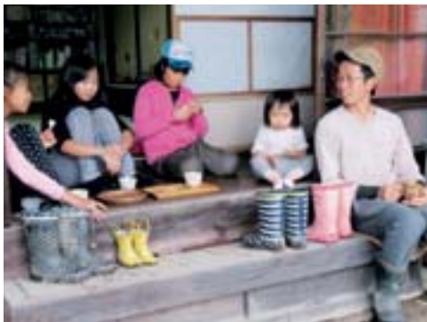
別の農家さんでは、縁側でのんびりトーク