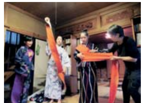
浴衣の着付け体験をする農家さんも

後日、親御さんから「今までは料理を全然しなかったけど、自分から手伝ってくれるようになった」と喜びの声が届きました。子どもたちにとって、親や先生以外の大人と出会う機会は、貴重な体験になったようです。