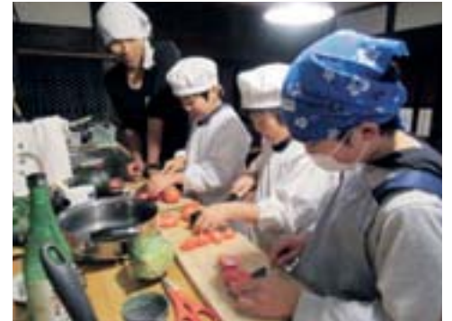
収穫した野菜でスープ作り

子どもたちは友達と泊まれるというワクワク感でいっぱい。聞けば、友達同士で泊まる体験はほとんど無いとのこと。親御さんに期待することを伺うと「なんでも体験し、自分で出来るようになって欲しい」「ゲームが無い生活をして欲しい」とのことでした。※農家(田舎)民宿ではゲーム禁止です。