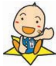
街頭巡視活動の様子