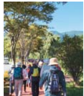
諏訪湖一周ウォーク