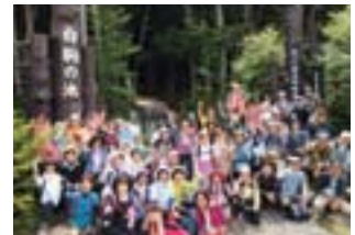
白駒の池ハイキング

注意：上記のカリキュラムはデータ転送日とは別に実施しますので、実施日は火曜日ではありません。