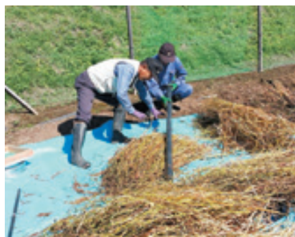
▲10月の収穫作業体験の様子(柏原)