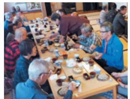
▲12月の新そば試食会の様子(合同)

そば畑サポーター制度に関するお問合せは (一社) ちの観光まちづくり推進機構(ちの旅案内所)へ。