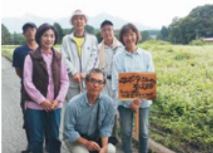
▲9月に行われたお花見交流会(金沢)

「八ヶ岳西麓そば畑サポーター」の制度は、今はまだ小規模ですが、将来的には市外の人と市内の農家さんをつなぐことで、遊休地が増えるのを防ぎ、茅野の美しい景観を残していくことをめざして今後の活動を広げていきたいと考えています。