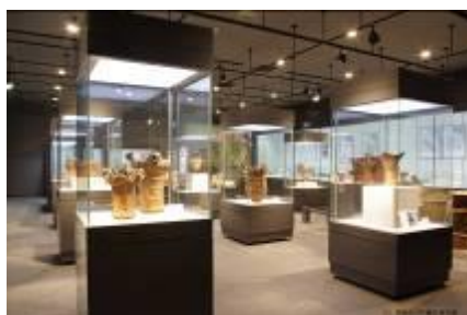
35 1.53MB (展示風景 C)