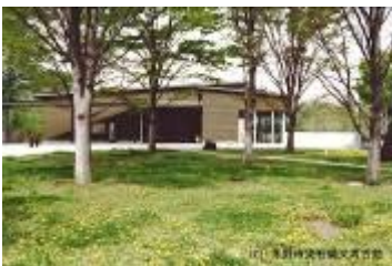
31 753KB (外観 2)