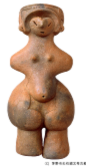
12 1.43MB (正面背景透過)