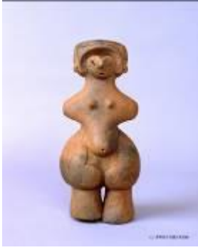
1 1.93MB (写真No.1)