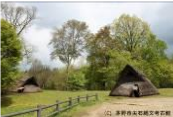
29 662KB (130518)