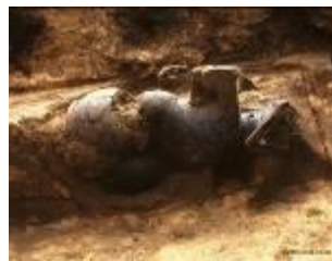
20 1.95MB (出土状況No.6-1)