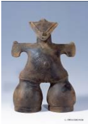
15 1.47MB (写真No.2-1)