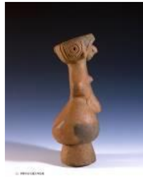
7 1.7MB (写真No.33)