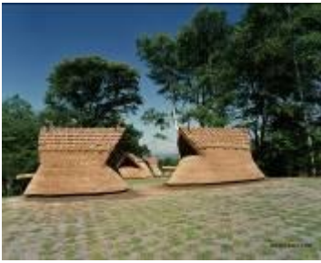
27 2.63MB (東から)