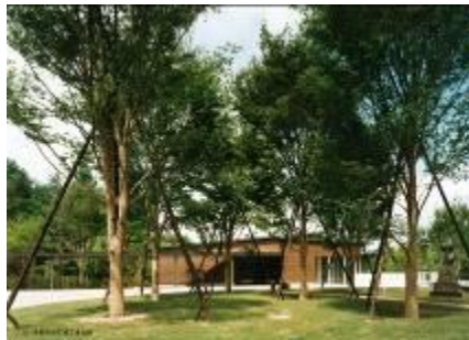
33 3.16MB (外観 4)