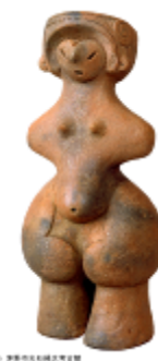
13 1.43MB (左斜め背景透過)