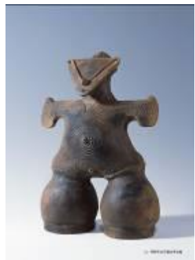
16 1.77MB (写真No.3-1)