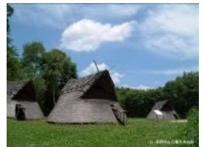
25 1.28MB (リーフレット)