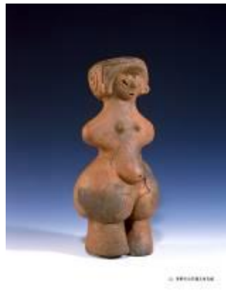
6 1.62MB (写真No.28)