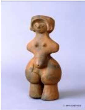
2 1.73MB (写真No.2)