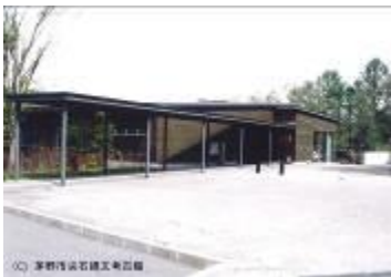
30 361KB (外観 1)