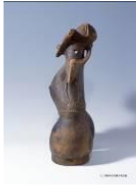
18 1.21MB (写真No.4-1)