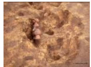
11 1.6MB (写真No.なし)