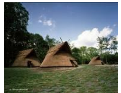
26 2.32MB (与助尾根 1-2)