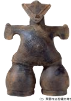
23 2.18MB (正面背景透過)