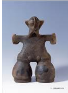
19 1.67MB (写真No.2-2)