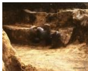
21 1.77MB (出土状況No.7-1)