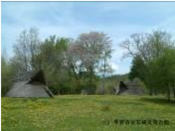
28 484KB (春)