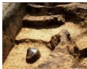
22 2.27MB (出土状況No.8-1)