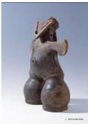
17 1.63MB (写真No.5-1)