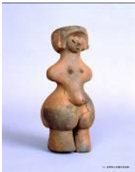
3 1.93MB (写真No.3)