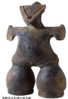
24 2.17MB (左斜め背景透過)