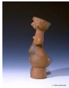
8 1.56MB (写真No.30)