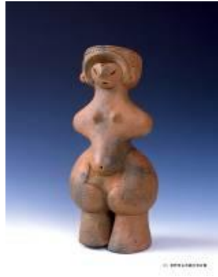
5 1.65MB (写真No.17)