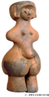
14 1.44MB (右斜め背景透過)