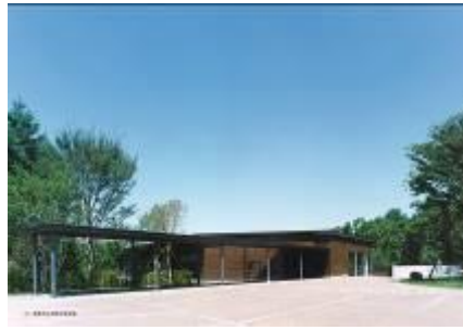
32 2.17MB (外観 3)