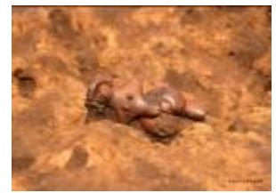
10 1.86MB (出土状況No.67)