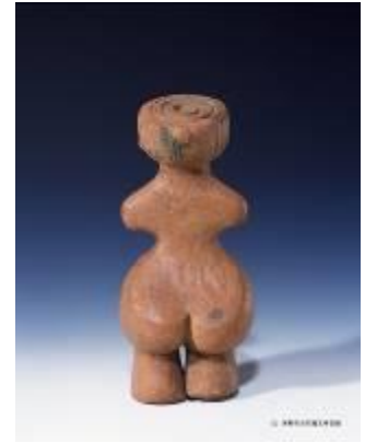
9 1.48MB (写真No.34)