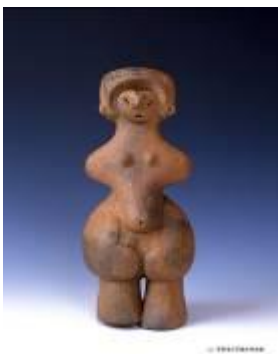
4 1.67MB (写真No.12)