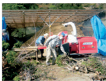
活躍するチッパー

庭木の剪定をしました。美サイクルセンターではチップ化しているようだけど、もらえるのかな～？ 難易度 ★★☆☆☆