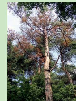
▲松くい虫被害木

クロマツやアカマツを枯らす森林害虫を松くい虫と呼びます。被害木は葉が赤褐色又は黄褐色に枯れあがり、最後には葉が全て落ちてしまいます。また、幹を傷つけた際に松ヤニがでないことも特徴です。