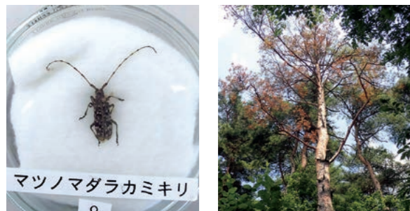
↑マツノマダラカミキリ ↑松くい虫被害木

▶ 松くい虫とは クロマツやアカマツを枯らす森林病害虫を松くい虫と呼びます。被害木は葉が赤褐色又は黄褐色に枯れあがり、最後には葉が全て落ちてしまいます。また、幹を傷つけた際に松ヤニがでないことも特徴です。