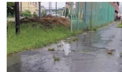
令和5年6月2日 茅野市ちの上原で撮影

雨水が下水道に流れ込むと、汚水があふれ道路のマンホールの蓋が開くなど重大事故につながる危険性があります。宅地内や道路にたまった雨水を流すために、汚水マスやマンホールを開けることは認められません。（転落事故につながり非常に危険です）