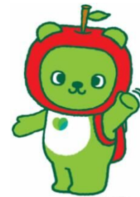
長野県PRキャラクター「アルムマ」