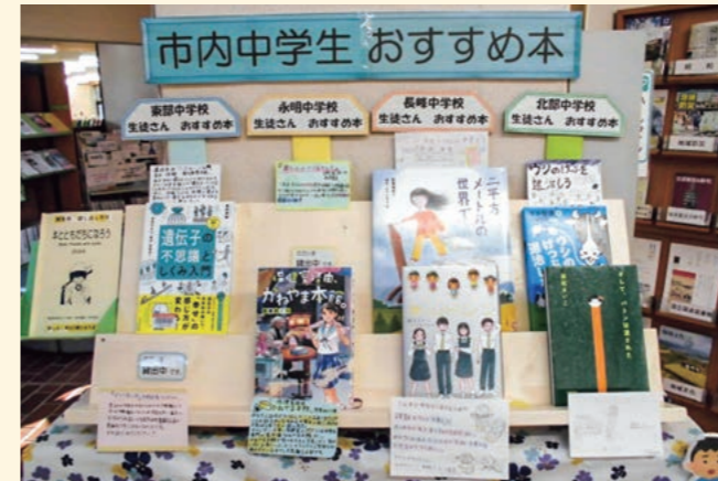
※写真は昨年のものです。

■「市内中学生おすすめ本」特設コーナーのお知らせ 市内中学校司書が中学生に読んでほしい本をまとめて制作した「本とともにだちになろう」2026年版の冊子(154冊)の中から、市内4中学校の生徒さんが「おすすめ本」として選んだ本を紹介POPとともに特設コーナーで紹介しています。図書館へお越しいただき、手に取ってご覧ください。