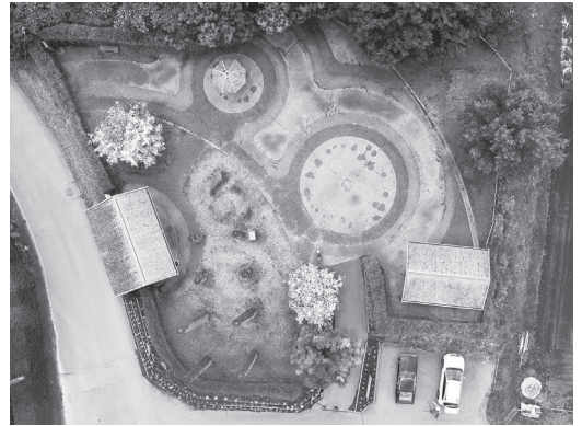
上空から見た中ツ原遺跡

永明寺山古墳出土遺物は、上記古墳発掘時に出土した資料群です。土師器・須恵器といった食膳具のほか、銀象嵌装飾の施された鍔を持つ大刀や、多くの鉄鏃・馬具、玉類が出土しています。武具類が多いところから、武人的性格をもつ被葬者ではないかと考えられます。出土遺物の時期差から複数人の埋葬が行われたと考えられます。各遺物の出土位置、状況が記録することができた、市内では希少な例です。出土遺物のうち251点を指定しました。