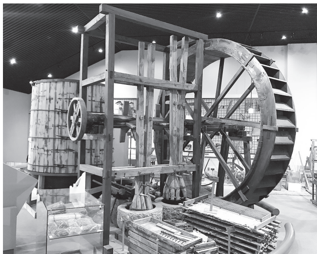
展示されている寒天づくりの道具