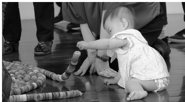
触ることができる作品は触って鑑賞

現に向けて打合せを重ねました。本番前日には、展覧会会場をスタッフ全員で周り、当日の流れや注意事項、展示作品の確認を行いました。