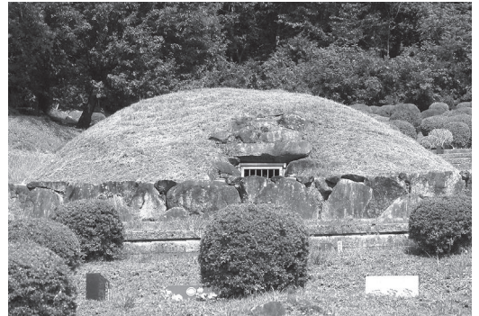
永明寺山古墳 写真