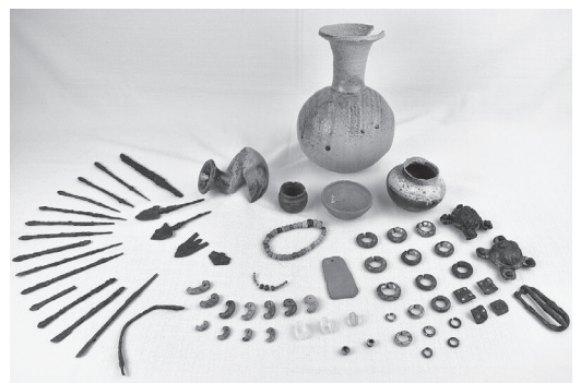
永明寺山古墳出土遺物

茅野市の博物館・文化財だより 八ヶ岳通信 No.44 発行年月日 令和8年3月31日