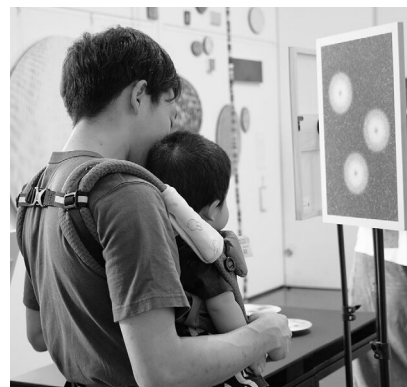
作品をじっと見つめる姿

手足をパタパタと動かしたり、作品や天井、窓の外の風景をじっと見つめたり、かわいらしい「喃語(なんご)」を発したり……。赤ちゃんによって関心を持つ対象が全く異なることに改めて気づくひとときとなりました。