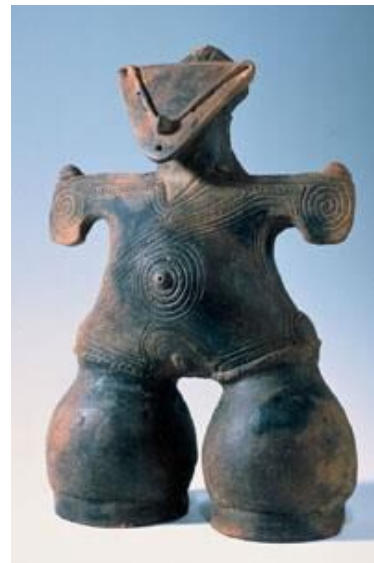
茅野市から出土した国宝「土偶」（縄文のビーナス）【左】と 国宝「土偶」（仮面の女神）【右】