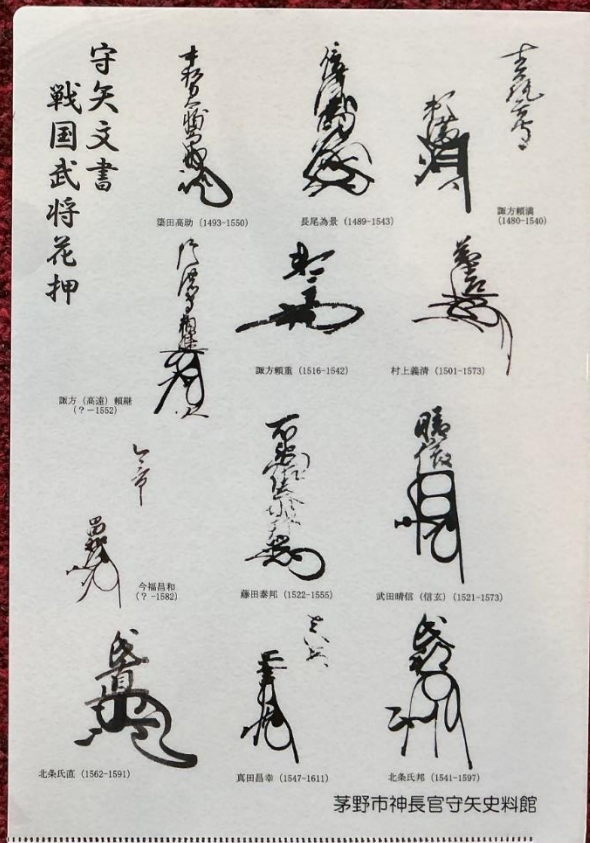
戦国武将花押クリアファイル