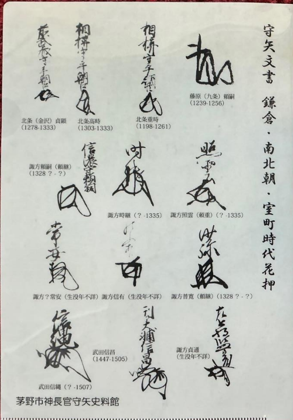
南北朝時代花押クリアファイル