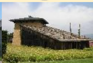
神長官守矢史料館