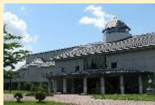
ハヶ岳総合博物館

講演会や学習会もその都度入館料を支払わなくても参加できます。(別途受講料等がある場合があります)