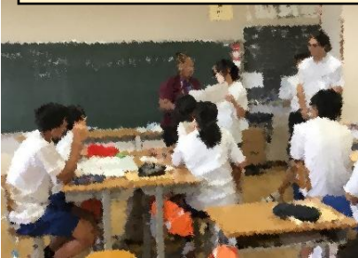
「日本語で自己紹介」や「英語俳句」に交流しながら取り組みました