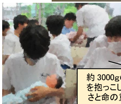
約3000gの赤ちゃんの人形を抱っこしました。実際の重さと命の重さを感じました。