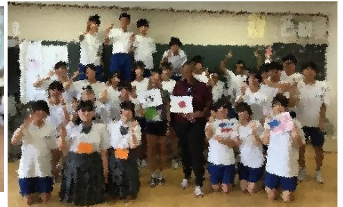
笑顔で記念写真撮影