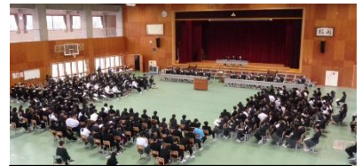
13日は2年生初の生徒総会も！