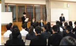
13日、3年生同窓会入会式。