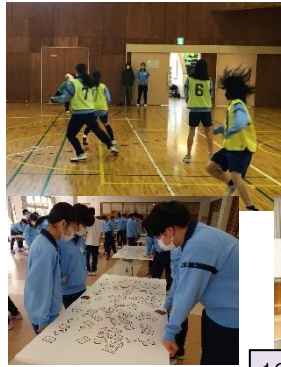
7～9日に各学年クラスマッチ開催。密を回避するため、試合のないときは百人一首も同時進行！！