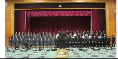
14日、荘厳に三年生を送る会実施。