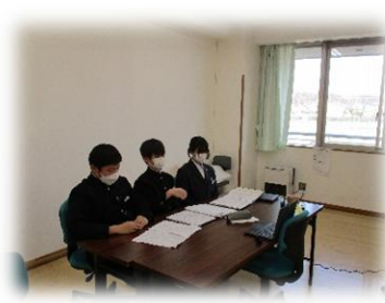
進行を行う議長団