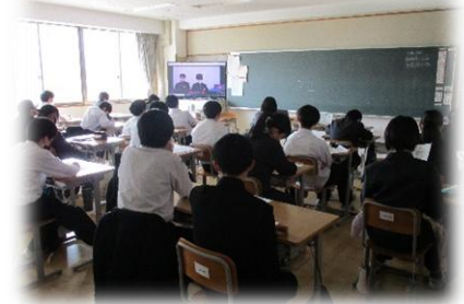
自分の教室で総会に参加をする生徒