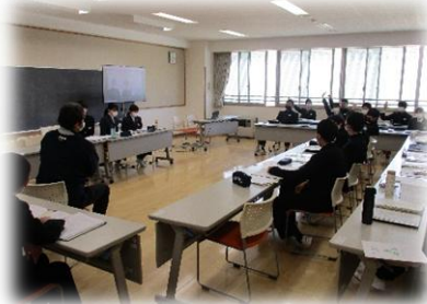
議案の説明を行う役員

そして、2年生は、12月に3年生から生徒会のバトンを引き継ぎ、長峰中学校のリーダーとしての活動を始めています。先日は、2年生が中心となって行う初の生徒総会が行われました。新たな始まりの生徒総会として、全校で集まって行いたいという強い思いがありましたが、コロナ禍のために断念せざるをえませんでした。そして、そこで、考えたのが全教室と生徒会役員、議長団をリモートでつないで行う「オンライン生徒総会」でした。通常の準備や運営に加え、リモートならではの難しさや大変さもあつたかと思いますが、大変スムーズに、新しい形の「生徒総会」を見事にやりきりました。