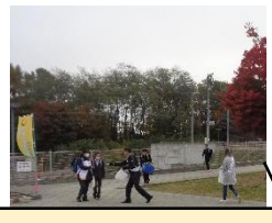
左:あいさつ運動(10/1) 右:挨拶啓発運動(11/4)