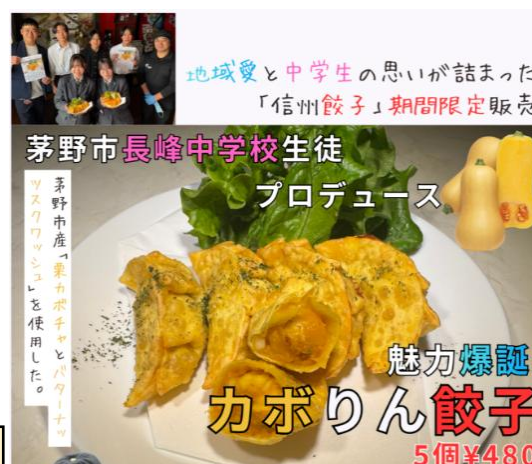
信州餃子「バガボンド」と コラボして餃子の商品開発

市役所、市内企業の方々、保護者の皆様等、多くの方のご理解とご支援をいただき活動が充実しています。生徒にとって、この多くの出会いやつながりがこの先の人生に大きくプラスに働くことと思います。皆様方に感謝申し上げますとともに、引き続きご支援のほどよろしくお願いいたします。