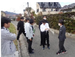
交通安全対策班 市担当の方々と現地で相談