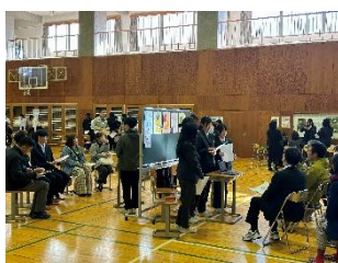
11月20日 発表会 大勢の方に来ていただきました。

3学年の「茅野市の魅力向上プロジェクト」は11月20日の参観日で、お世話になった方々を招待し、中間発表会を行いました。また、その後も継続的に活動している班もあり、活動の様子や成果を新聞等で取り上げていただいています。