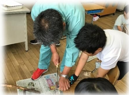
今までの活動の様子

今後も米沢小では、学級で何か1つ、子どもたちが夢中になって取り組める活動を行っていきたいと思います。