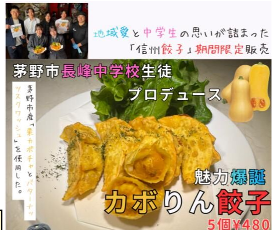
信州餃子「バガボンド」と コラボして餃子の商品開発

市役所、市内企業の方々、保護者の皆様等、多くの方のご理解とご支援をいただき活動が充実しています。生徒にとって、この多くの出会いやつながりがこの先の人生に大きくプラスに働くことと思います。皆様方に感謝申し上げますとともに、引き続きご支援のほどよろしくお願いいたします。