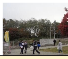
左:あいさつ運動(10/1) 右:挨拶啓発運動(11/4)