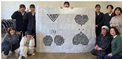
エコキャップアートチーム アルミ缶回収で資金を集め、 アートの企画を展開