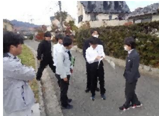
交通安全対策班 市担当の方々と現地で相談