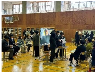
11月20日 発表会 大勢の方に来ていただきました。

3学年の「茅野市の魅力向上プロジェクト」は11月20日の参観日で、お世話になった方々を招待し、中間発表会を行いました。また、その後も継続的に活動している班もあり、活動の様子や成果を新聞等で取り上げていただいています。