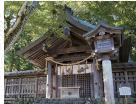
諏訪大社上社前宮