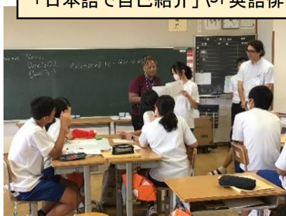
「日本語で自己紹介」や「英語俳句」に交流しながら取り組みました