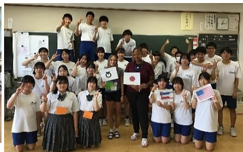
笑顔で記念写真撮影