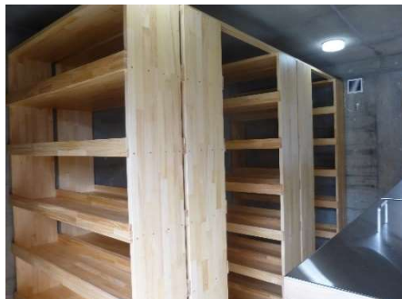
納骨室（個別埋葬用納骨棚）