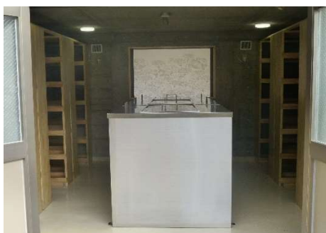
納骨室（共同埋葬用納骨箱）