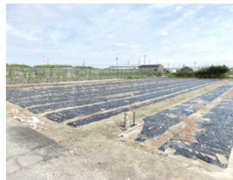
交付対象となっていた水田 (畦畔はない)