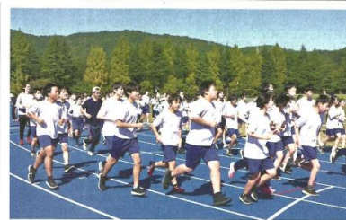
茅野市運動公園陸上競技場を元気にスタートする3年生

10月17日、秋晴れの絶好のコンディションの中、4年ぶりとなる 強 歩大会を開催しました。運動公園のウォーキングコースを使った新しい試みとして実施しました。周回コースを3周する約8kmのコースでしたが、自分の体調や体力に合わせて、マイゴールを決めるなど、すべての生徒が達成感を味わえる形に工夫し実施いたしました。おかげさまで、スタートした生徒全員は、だれ一人途中棄権することなく、全員が無事ゴールテープを切ることができました。形が変わったとはいえ長峰中学校の伝統行事が復活できたことは何よりもうれしいことでした。また、ゴールした時の生徒たちの充実した表情がとても印象的でした。