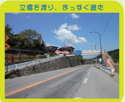
立橋を渡り、まっすぐ進む