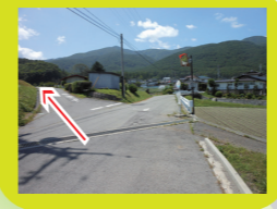
前方に サンコーポラスが見えます ながめ良好