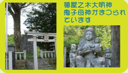
神屋之木大明神 抱子母神がまつられて います