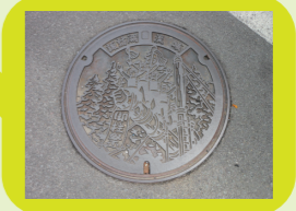
青柳橋をわたってすくの 三叉路を右へ曲がります。 左の曲がり口のマンホールが 御柱祭