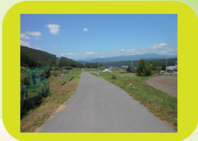
たんぼの中の道 ながめ良好 木陰なし