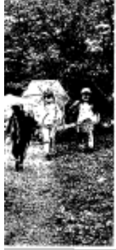
茅野市で、梅雨入り後の様子。大雨の恐れがあるため、警戒を呼び出している。

関東甲信梅雨入り 大雨の恐れ、警戒を 関東甲信地方は9日、梅雨明けを告げる曇り空が続き、午後からは大雨の恐れがある。気象庁は、大雨による土砂災害や冠水などの危険性を警戒している。茅野市では、河川の水位が上昇しているため、警戒を呼び出している。 茅野市では、河川の水位が上昇しているため、警戒を呼び出している。気象庁は、大雨による土砂災害や冠水などの危険性を警戒している。茅野市では、河川の水位が上昇しているため、警戒を呼び出している。