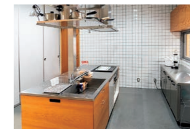
キッチンスタジオ