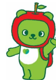
長野県PRキャラクター「アルママ」 ©長野県アルママ

長野財務事務所 026-234-2970 ※平日 8:30～12:00、13:00～16:30