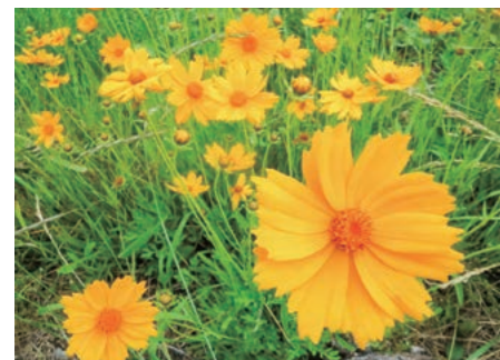
↑オオキンケイギク