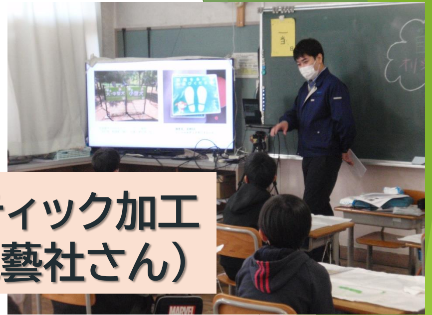
プラスチック加工 (目黒工藝社さん)