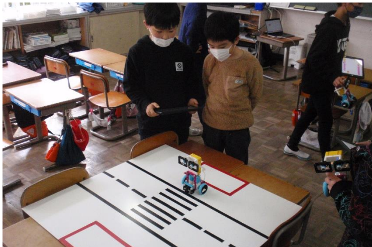
プログラミング教室の先生