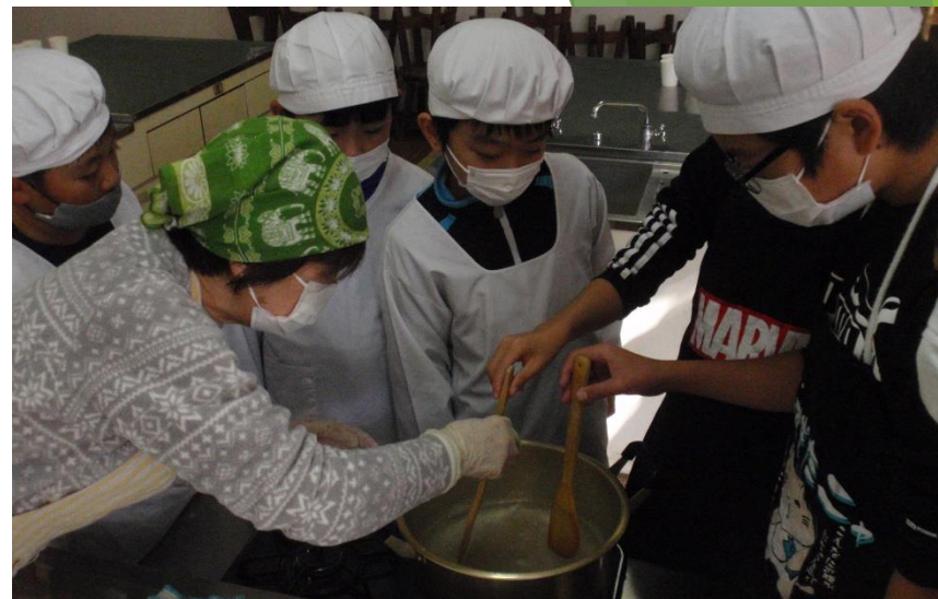
寒天屋さん(かんてんや)