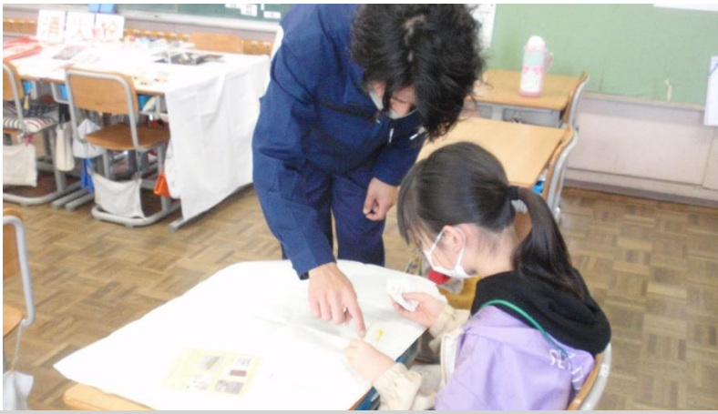
精密加工(太陽工業さん)