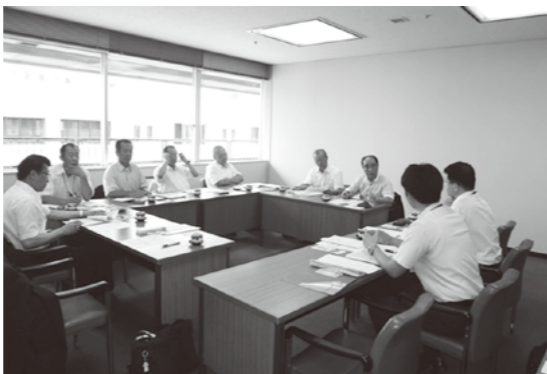
福岡市 リース方式のLED化についての説明を受ける

茅野市においても24時間点灯が必要な施設や高所に設置されている設備(例:消防署・施設誘導灯・体育館等)で、試験的にリース方式によるLED照明への改修を実施して費用対効果等の検証をし、新規に建設される公共施設などでは積極的にLED化に取り組み、CO 2 やランニングコストの削減を追求する必要があります。