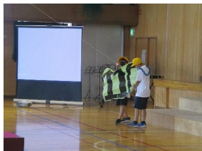
紙飛行機でメッセージを届ける

か、どんなところに注目して聴いてほしいかなど調べて子ども自身の声で曲紹介をしてくれたのです。また、エンディングでは、校歌や玄関上にあるレリーフの事について、取材をしてまとめ、最後に発表してくれました。