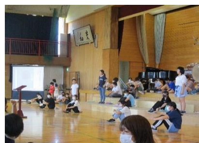
校歌とレリーフの由来発表

これらは「考える子」そのものですね。素晴らしい取り組みをした6年生に拍手を送りましょう。