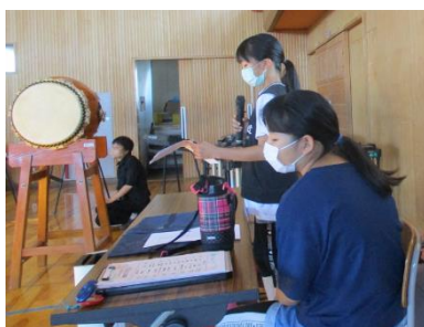
子どもの声で曲紹介