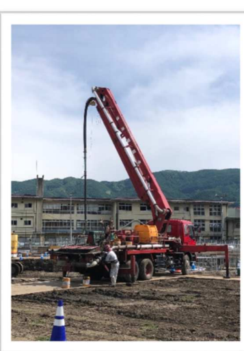
～コンクリートポンプ車～ コンクリートを枠の中に流しこむのに使われています。