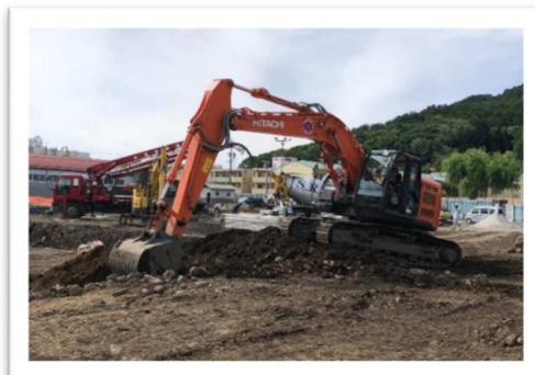
～ショベルカー～ 地面をほったり平らにならしたりするのに使われています。