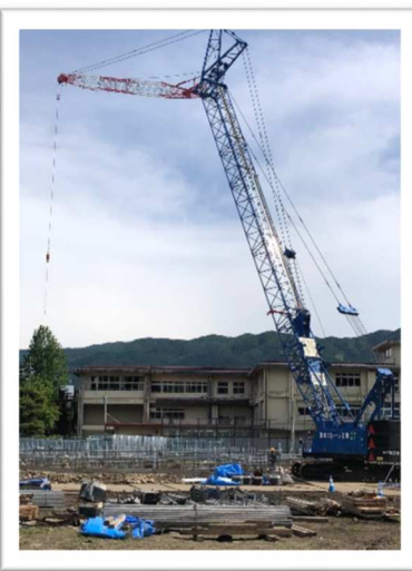
～クレーン車～ 工事に使う材料をはこんだり、移動させたりするのに使われています。