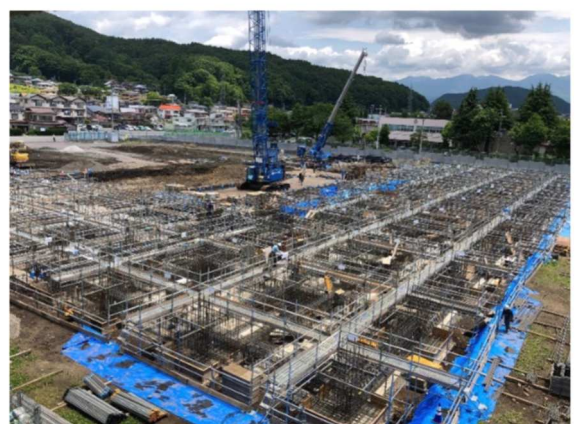
新校舎の現在の様子です。 新校舎の基礎ができてきています。