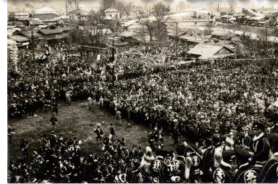
戦前の木落しの様子

長い歴史がある御柱祭。御柱祭の起源について記された古文書や、古い写真・史料などを通じて、これまでの御柱祭の様子を伝えます。