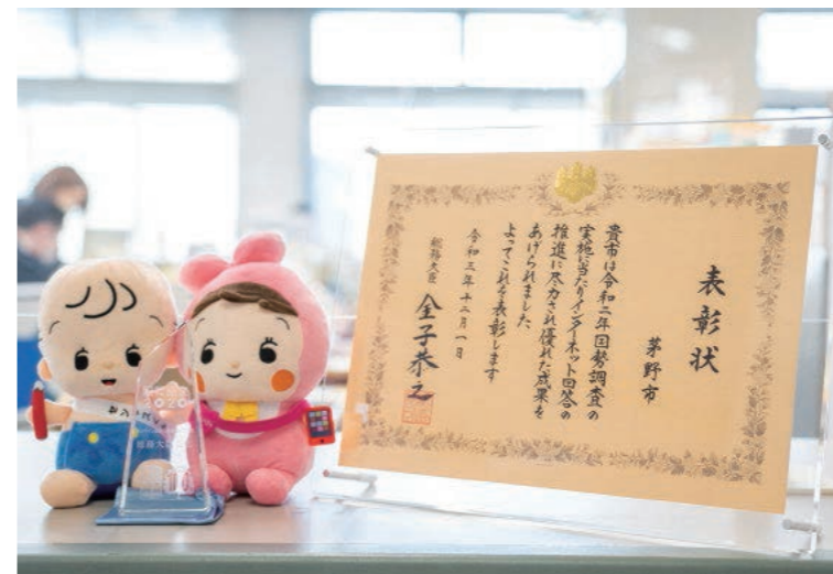
↑市役所2階企画課窓口で飾っています。 →国勢調査の結果はQRコードからご覧いただけます。