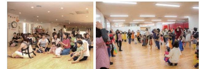
↑親子で楽しめるイベントも開催しています。