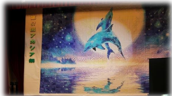
全校生徒で作上げた ステージバック

10月1日(金)、2日(土)に、第57回アカシア祭が行われました。昨年度に引き続き、残念ながら新型コロナウイルス感染症拡大の影響を受け、例年通りの開催とはいきませんでした。生徒会役員が長い時間をかけて創意工夫を凝らした計画を立て、3年生が全校をリードし、1、2年生が精一杯に協力・参加し、素晴らしいアカシア祭を作り上げました。全校生徒で一つになって、様々な活動に一生懸命に取り組む姿は、まさに「一致団結 ～輝く未来へ～」という今年度のアカシア祭テーマそのものでした。準備から含めると、長い時間をかけて作り上げてきたものが、2日間に凝縮され、全校生徒でたくさんの充実感や感動を味わったアカシア祭となりました。