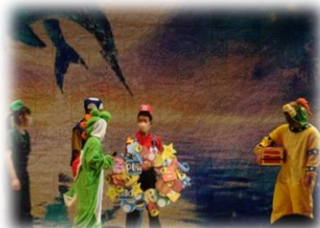
閉祭式での生徒会役員による 劇