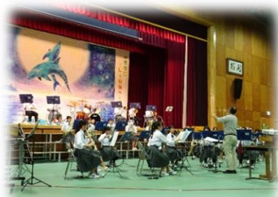
吹奏楽部による アカシアコンサート