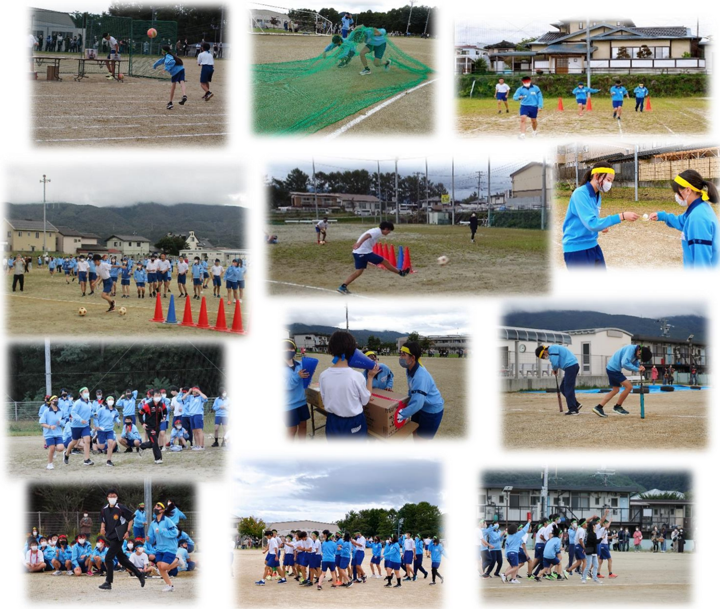
学年ごとに、クラス対抗で、創意工夫を凝らした7種目[空き缶タワー 伝言ジェスチャーゲーム 先生を笑わせろ! トレジャーハンター 学カテスト 挨拶グランプリ ワンフレーズカラオケ ]で大いに盛り上がった 生徒会企画「アカシア ユニティー」