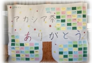
次に生徒会を引き継ぐ二年生より 三年生に贈られた 感謝のメッセージ

素晴らしいアカシア祭でした。このアカシア祭で、準備の段階、そして本番と生徒の皆さんが、それぞれの場でそれぞれの頑張りを発揮しました。ここで「一致団結」できたことを、これからの長峰中学校の生活でどう活かしていくのか、みなさんの姿を見ていて、とても楽しみになりました。生徒会引継ぎも近づいています。次へ向かって進んでいきましょう。