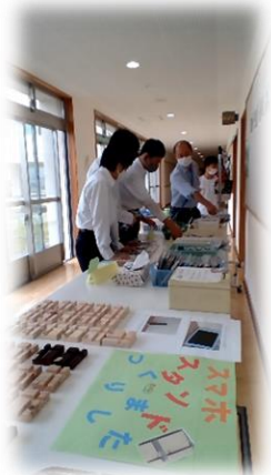
たいよう学級による、学習成果作品の 展示・販売