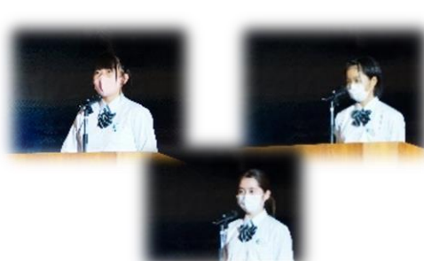
3年生による 英語スピーチ