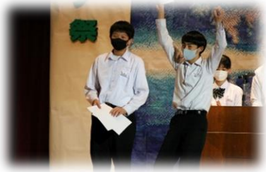
閉祭式で行われた 各種表彰