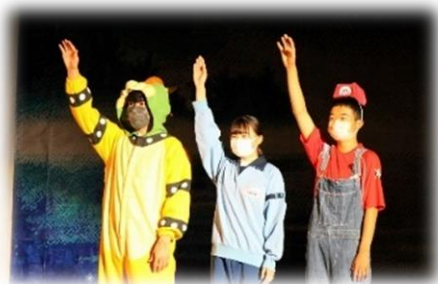
開催式でのオープニングの劇に続き行われた生徒会三役による 開祭宣言