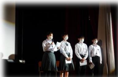
様々な形式で行った 国語科意見発表