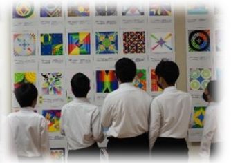
充実した学習成果の 展示発表