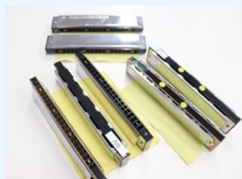
演奏する曲によってハーモニカを替えます