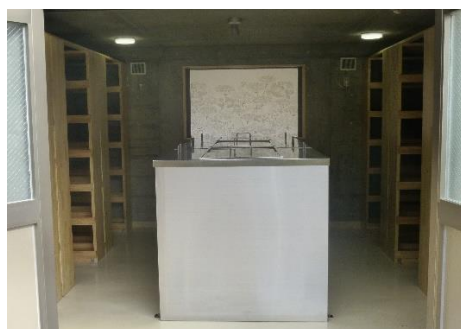
納骨室（個別埋葬用納骨棚）