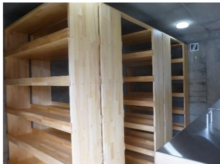
納骨室（共同埋葬用納骨箱）