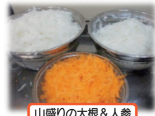
山盛りの大根&人参