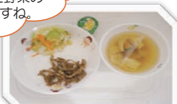
「わかさぎの甘辛がらめ」