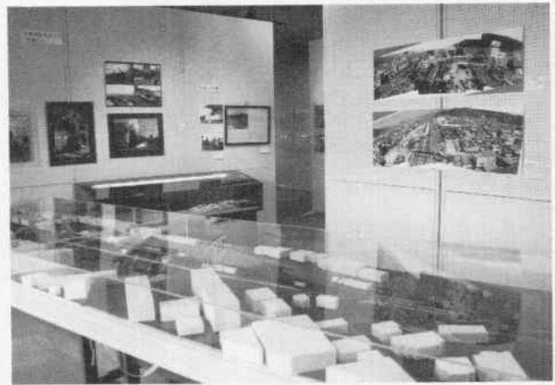
展示会の様子 (模型・昭和38年頃の茅野駅を中心に)