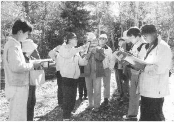
「茅野の鉄道史跡を歩こう」（10月23日開催）