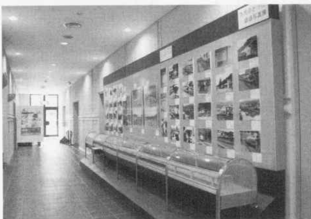
ロビー展示「市民のつた鉄道写真展」