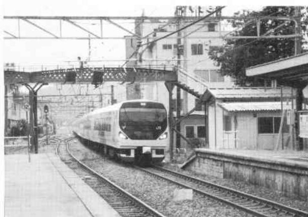
撮影会「鉄道写真を撮ろう」(10月8・9日開催)