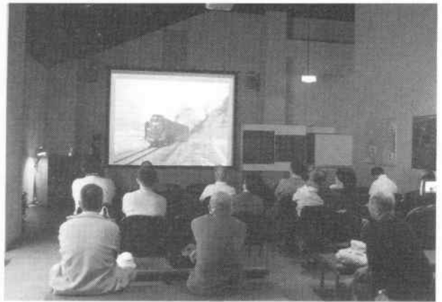
講演会「茅野の今昔」（10月22日開催）