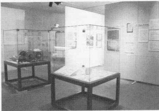
展示会の様子 (切符を中心に)