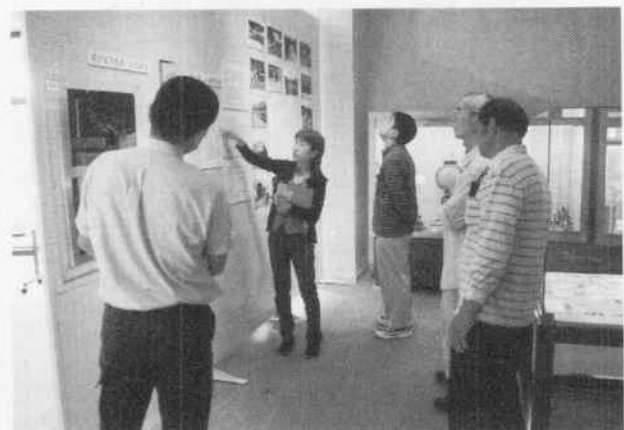
展示解説の様子 (10月2日開催)