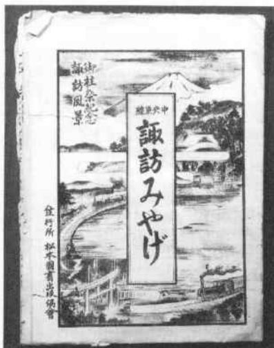
諏訪みやげ（当館蔵）