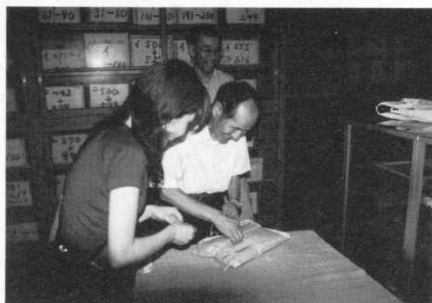
資料調査の様子 (9月13日 東西茅野区酉蔵にて)