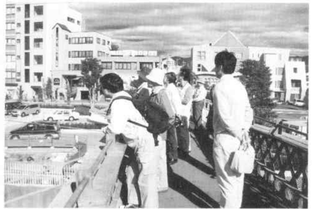
「茅野の鉄道史跡を歩こう」（10月23日開催）