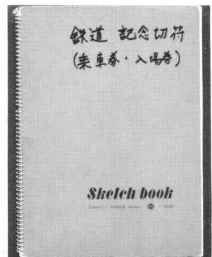
鉄道記念切符内ファイル(当館蔵)