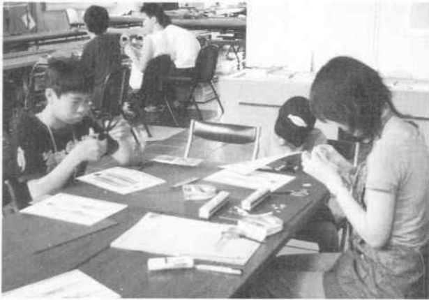
「鉄道模型で遊ぼう」（8月6日開催）