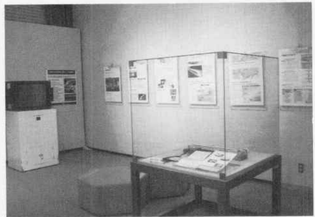
展示会の様子 (未来の鉄道 中央新幹線)