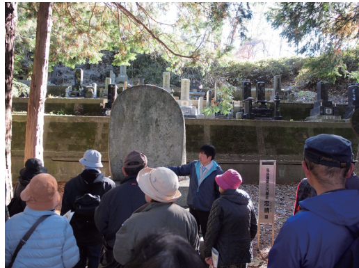
諏訪氏廟所バスハイク