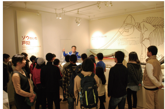
子ども自然研究クラブ