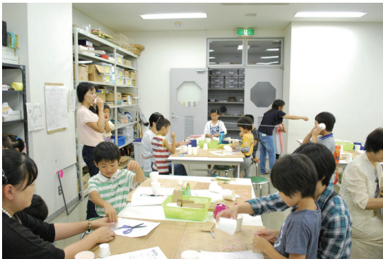
夏休み子ども教室