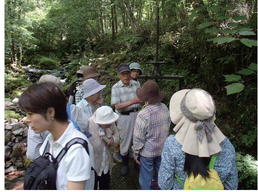
大河原せぎ見学バスハイク