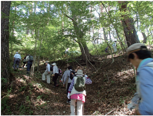
上原城を探検する