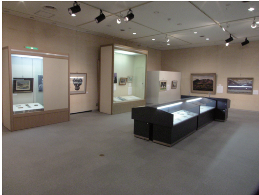
企画展「博物館の絵画」