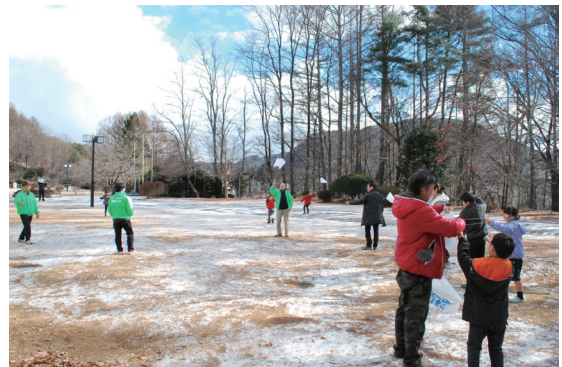
わくわく実験工作教室