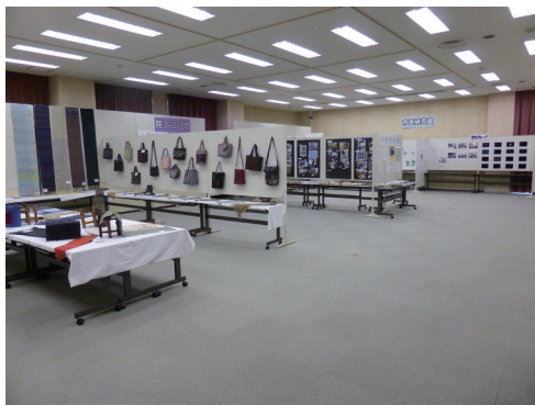
博物館活動発表展