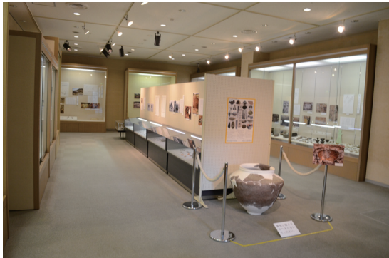
企画展「茅野の中世遺跡」