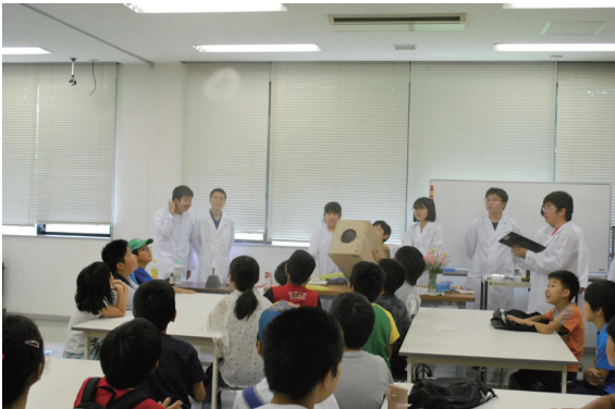
子ども科学工作クラブ