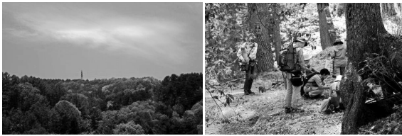
講師 岩波 均先生