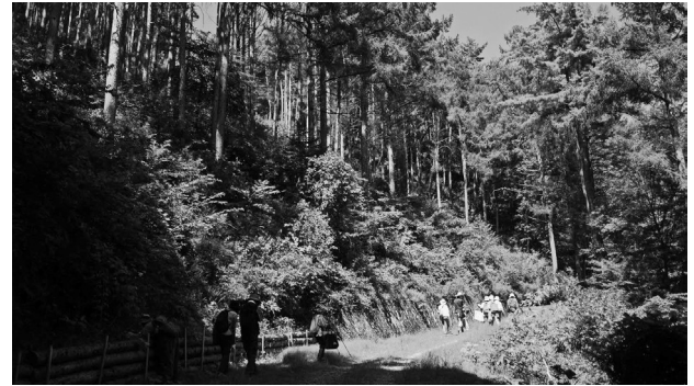
講師 岩波 均先生 坂口 竣弥先生

● 確認植物 アキノゲシ・アサザ・アメリカアゼナ・アメリカホドイモ・アレチウリ・イタチハギ・イヌゴマ・イヌホウズキ・イノコズチ・ウキクサ・ウキヤガラ・エゾノギシギシ・オオアカバナ・オオイヌタデ・オオアワダチソウ・オオハンゴンソウ・オオブタクサ・オオニシキソウ・オギ・ガガイモ・カヤツリグサ・カナムグラ・ガマ・カワヤナギ・キシヨウブ・キヌヤナギ・キレハイヌガラシ・クサイ・クサヨシ・クスダマツクサ・クロモ・コウホネ・コメツヅメクサ・ササバモ・シロバナシナガワハギ・セキシヨウモ・セリ・タカサブロウ・チョウジタデ・ドクゼリ・トゲチシャ・ハゴロモモ・ヒシ・ヒレタゴボウ・ヘラオモダカ・ヘラオオバコ・ホソバミズヒキ・マコモ・マツヨイグサ・ミズタマソウ・ハッカ・ムラサキツメクサ・メヒシバ・ヨシ